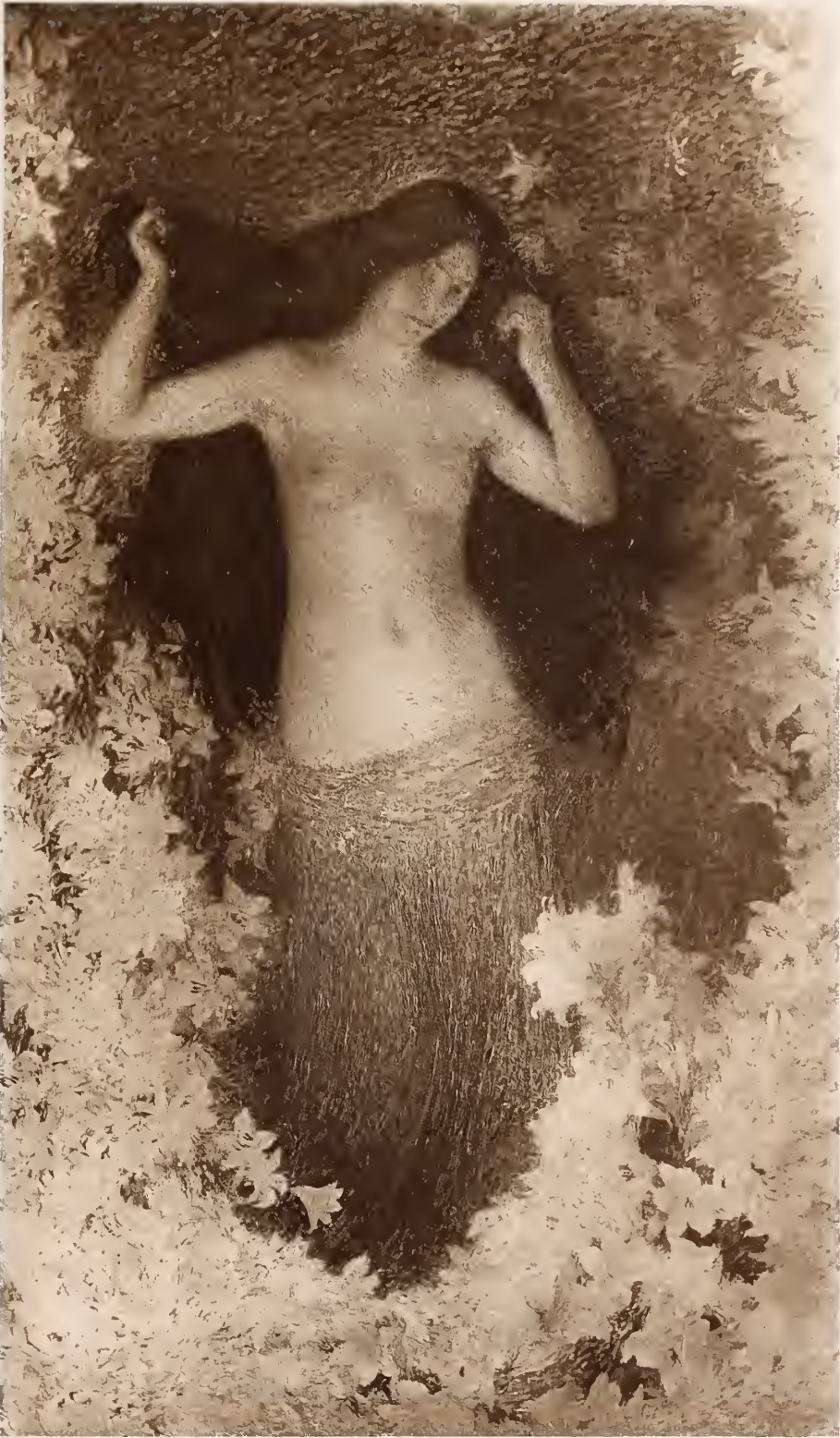
Procede et Imp. Georges Petit